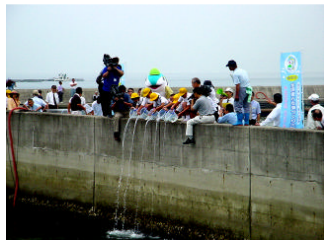
サワラ稚魚を放流する子供たち