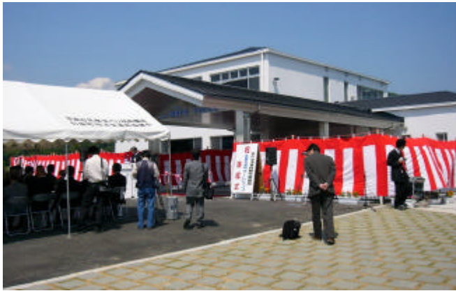
安戸池漁業体験施設「マーレリッコ」