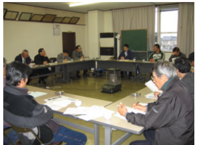
熱心に研修する参加者

今回の視察研修に参加した役職員一同、本研修会を基礎に、決意を新たに組織基盤強化に向け積極的に取り組んで頂きたいと思います。