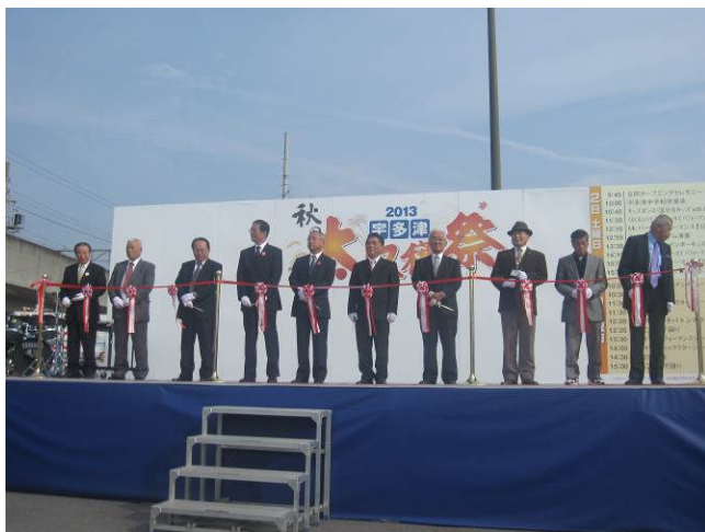
主催者テープカット

11月2日(土)、中讃2市2町と9漁協で設立した中讃海域漁業・漁村活性化協議会(事務局:多度津町産業課)が主催の「第11回中讃秋のびちびちとれたて市」がJR宇多津駅前南口広場で開催されました。