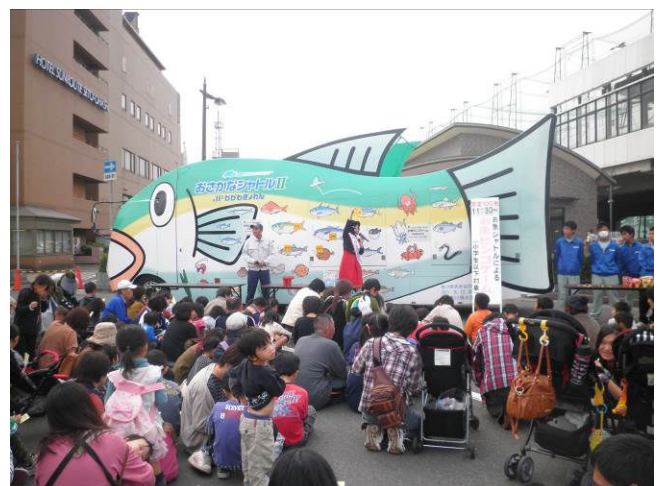
大盛況のお魚シャトルイベント

また、「お魚ビンゴゲーム」のお魚シャトルイベント、お魚タッチプールによるアジのつかみ取り、記念イベントの「本マグロの解体ショー&即日販売」などを行い大盛況のうちに終了しました。