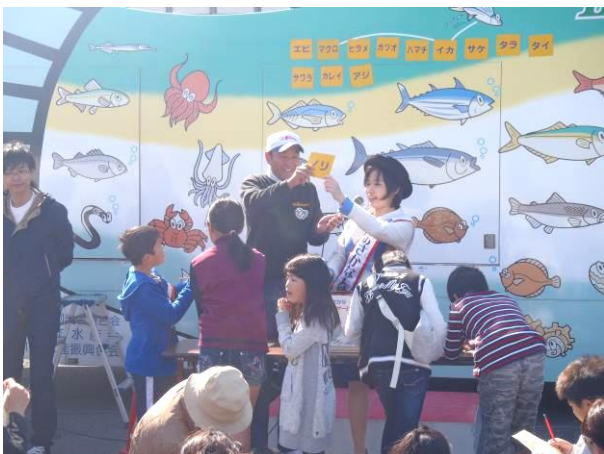
お魚ビンゴゲームで盛り上がる会場

会場ではその他にもおさかなシャトルによるお魚ビンゴゲームや、お魚タッチプールでのアジのつかみ取り等が行われました。どのイベントも大勢が参加し、大盛況のうちに終了しました。