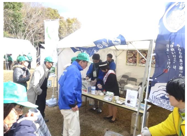
オリーブハマチしゃぶしゃぶ試食の様子

香川県漁連では、さぬき海の幸販売促進協議会から香川県産初摘み海苔、伊吹いりこの販売、またオリーブハマチのしゃぶしゃぶの試食を行い、多くの方々に好評をいただきました。