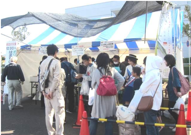
オリーブハマチしゃぶしゃぶ試食会の行列

11月4日(土)、中讃海域漁業・漁村活性化協議会(事務局:坂出市建設経済部産業課)主催の第15回中讃秋のぴちぴちとれたて市が宇多津町旧世界のガラス館駐車場で開催されました。2017年宇多津秋の大収穫祭と合同開催され、例年通り多くの人で賑わいました。