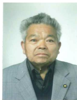
あおき しげる 青木 繁