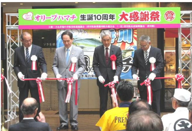
オリーブハマチ生誕10周年大感謝祭