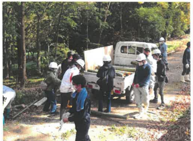
竹炭用の竹をトラックに積み込んでいる様子

本事業は2カ年計画で実施されており、今後の作業については関係団体との協力の下、笹竹を伐採し、令和4年3月にクヌギの植樹を行う予定です。