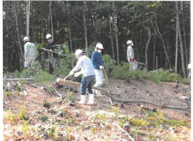
竹の伐採を行う漁青連部員

JF 香川県漁協青壮年部連絡協議会は、11月20日（土）に高松市東植田町の公洲森林公園内において、当漁青連部員、香川県みどりの整備課、香川県水産課等関係団体を含む計33名で、植樹のための竹の伐採を行いました。