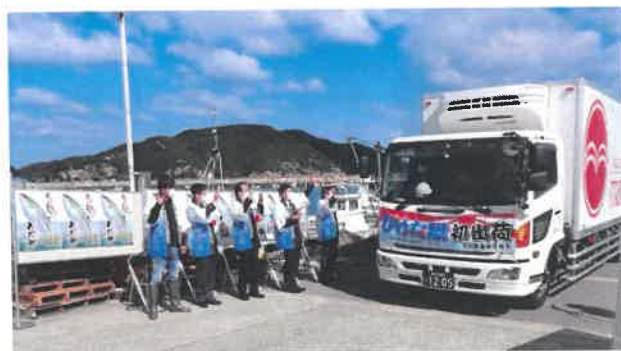
初出荷を見送る様子

10月29日(金)に引田漁港で行われた「ひけた鰯」初出荷式に参加させていただきました。柔らかな日差しが心地よい秋晴の下で開催された出荷式、ひけた鰯の生産者様を始め、引田小学校3年生の児童の皆さんのお陰で、活気溢れるものとなりました。児童の皆さんは大きくプリプリの身が締まったひけた鰯にくぎ付けでした。そして「お魚大好き」「鰯が一番好き」という声がとても嬉しかったです。出荷式では、出荷される鰯に手を振ってお見送りしました。香川が誇る、生産者様の愛いっばいに育ったひけた鰯が、これからたくさんの方の食卓に並ぶと思うと感慨深いものでした。