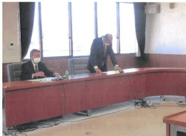
鳴野会長の開会挨拶

1月27日(木)漁連会館において、令和3年度第1回臨時総会が開催されました。本臨時総会は、香川漁連運輸株式会社解散の件について審議され、上程された議案は、原案通り全会一致で可決承認されました。