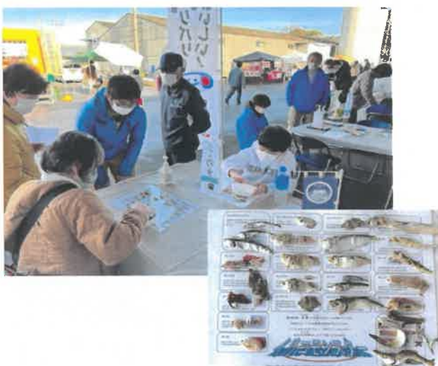
イリコモニターを探せ！を楽しんでいる様子

2月11日（土）西野金陵(株)多度津工場において「金陵酒蔵開き」にさぬき海の幸販売促進事業の一環として参加出展しました。3年ぶりに開催されたイベントでは多くのお客様が工場見学、新酒・限定酒の試飲即売会などを楽しんでいました。さぬき海の幸事業では無料お子様イベントとして、イリコモニターを探せ！と、貝殻お絵かきを行いました。