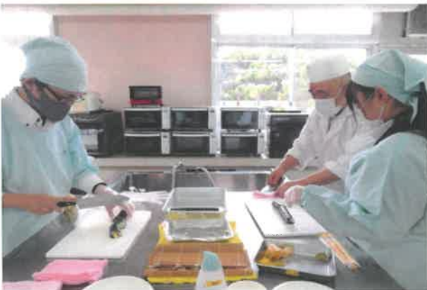
巻きずしの実習の様子

1月26日（木）香川県立石田高等学校の生活デザイン科の生徒を対象に、うまいもん出前講座を開催しました。うまいもん出前講座は、小中学校・高等学校等の児童生徒を対象に県産食材の魅力を知ってもらうための活動をしています。今回は、瀬戸の地魚について県産食材の特徴や魅力を講義し、香川県産海苔を使った巻きずしの調理、試食を行いました。