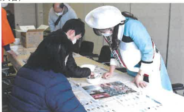
どの魚かな？写真と現物を確認中！

「イリコモンスターを探せ！」は、イリコと、一緒に獲れる魚類を乾燥させたものを混ぜたカップの中から、写真を見てどれがどの魚か探してもらうものです。小さなお子様から大人まで、どれがどの魚か夢中で探していました。普段見ないようなヒトデやカニの姿に驚かされている方も多くおり、思い思いに観察されていました。子供達に感想を聞いてみると、「あまり触れることの無い魚に触れた！」という声や、「昨日の給食で香川のノリも出てたよ！」という声が挙がっていました。今回のイベントで、お魚をより身近に感じて頂けたなら嬉しい限りです。（古川天音）