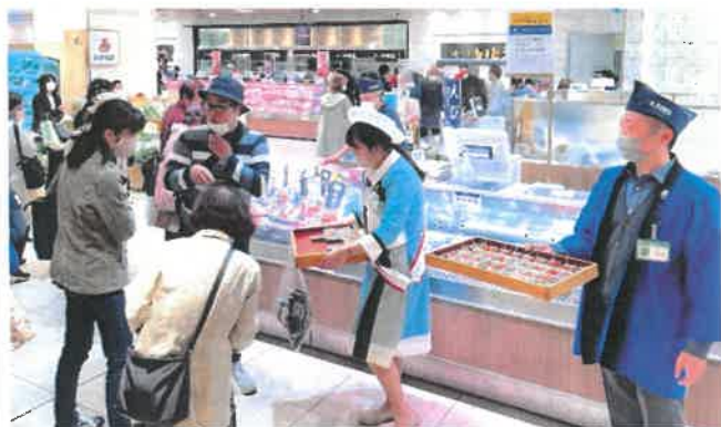
香川おさかな大使による試食販売の様子

県内での販売に先駆けて、4月7日～8日に阪神百貨店阪神梅田本店において、さぬき海の幸販売促進協議会のPR事業として、香川おさかな大使による讃岐さーもんの試食販売を行いました。県内では新鮮市場きむら、高松三越、ムーミーほかで販売しており、販売期間は約1ヵ月程度の予定となっておりますのでぜひご賞味下さい。