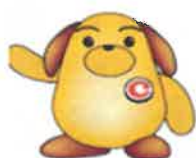
税関マスコット カスタム君

テロ関連物資の密輸阻止には皆様からの情報提供が大きな力となります。次のような不審人物や不審事象を発見した場合には、税関までご連絡をお願いいたします。