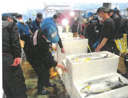
サワラ初競りの様子