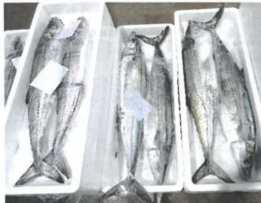
市場に並んだサワラ