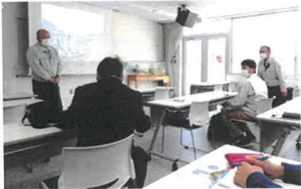
担当者からの説明の様子

今後の作業については、関係団体協力の下、今月中に香川県海域においてアマモ種子を回収し、秋頃からアマモ種子の播種を実施する計画としています。