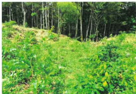
下草刈り後の様子