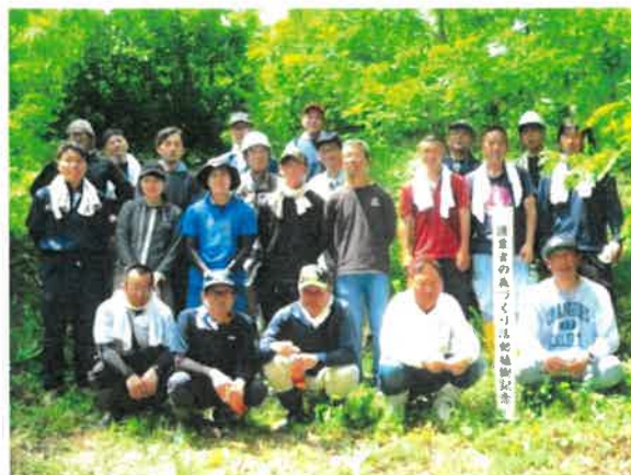
作業後の集合写真