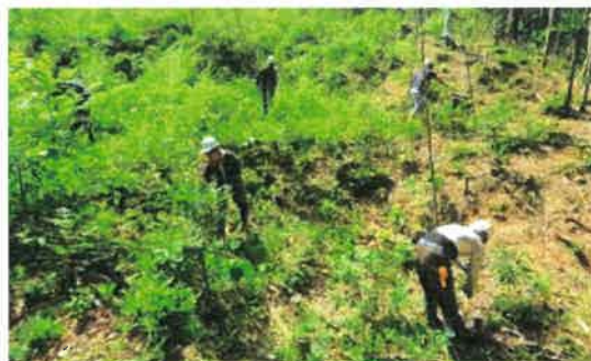
下草刈りを行う漁青連部員

当漁青連は令和2年11月より公洲森林公園における竹の伐採を開始し、令和4年3月に晴れてクヌギ苗木200本を植樹し、その苗木を成育させるために下草刈りを行いました。天候に恵まれ、各参加者は適宜水分補給を行いながら作業に取り組みました。苗木は順調に生育しており、今後の作業については、来年同時期に関係団体との協力の元、下草刈りを継続して行う予定です。